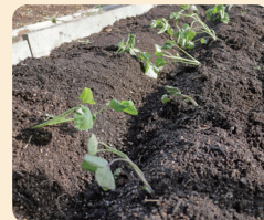
船底植えしたさつまいもの苗