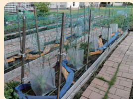
しっかり守られたスイカの苗

イチゴも十分に熟したものを摘んでいきます。収穫は5月下旬まで続きます。枯れたスナップエンドウを撤去する作業も行いました。菜園全体が緑であふれる季節になってきました。(藤掛)