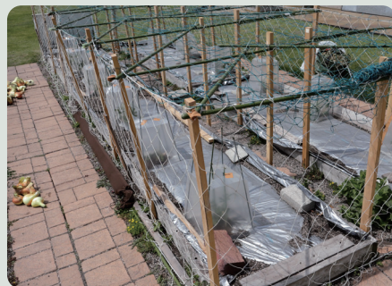
今年のスイカの強固な支柱

今月は上旬から中旬にかけて雨が少なく、屋上の土も乾燥気味となっていました。土や植物への注意深い観察とともに、野菜作りは進んでいきます。そんな今月はまず、スイカの苗の定植を行いました。植えたスイカの苗は風よけの行灯で囲い、さらに例年よりも強固に支柱を組んで上からネットをかけました。また、ジャガイモには追肥と土寄せを施しました。イチゴは5月を通して収穫となりました。真っ赤に熟した実から選んで摘み取っていき、5月後半には保育園の子どもたちにも収穫を体験してもらうことができました。5月22日、果樹の専門家の森先生に来て頂き、ブドウの花穂整理などの実地指導を受けました。実りが楽しみです。 (藤掛)