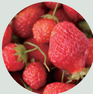
いちごがいっぱい採れました！